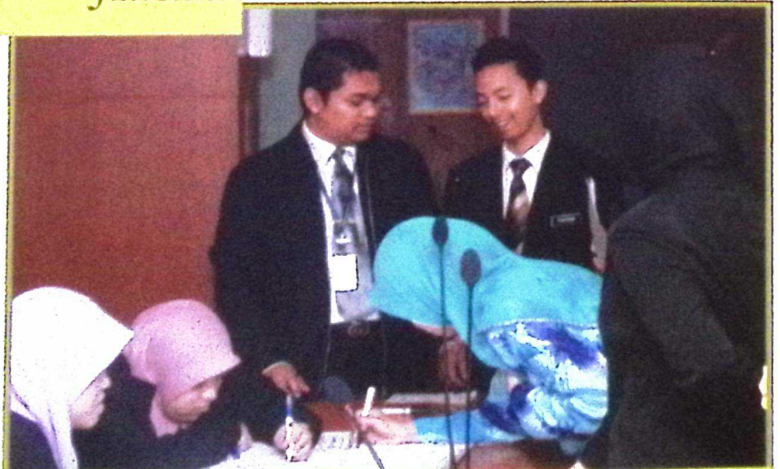
15-17 september 2008/15-17 ramadhan 1429h bilik mesyuarat utama JKSM