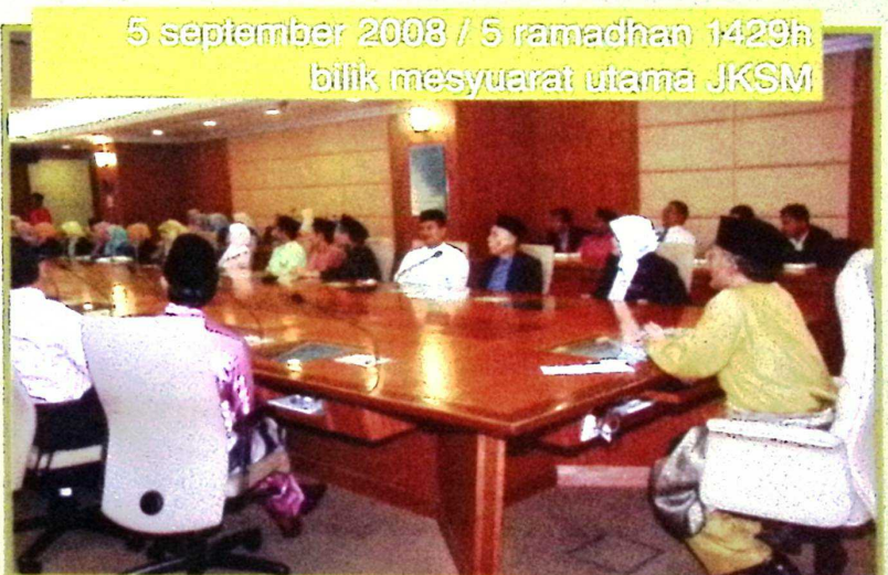
5 september 2008 / 5 ramadhan 1429h bilik mesyuarat utama JKSM