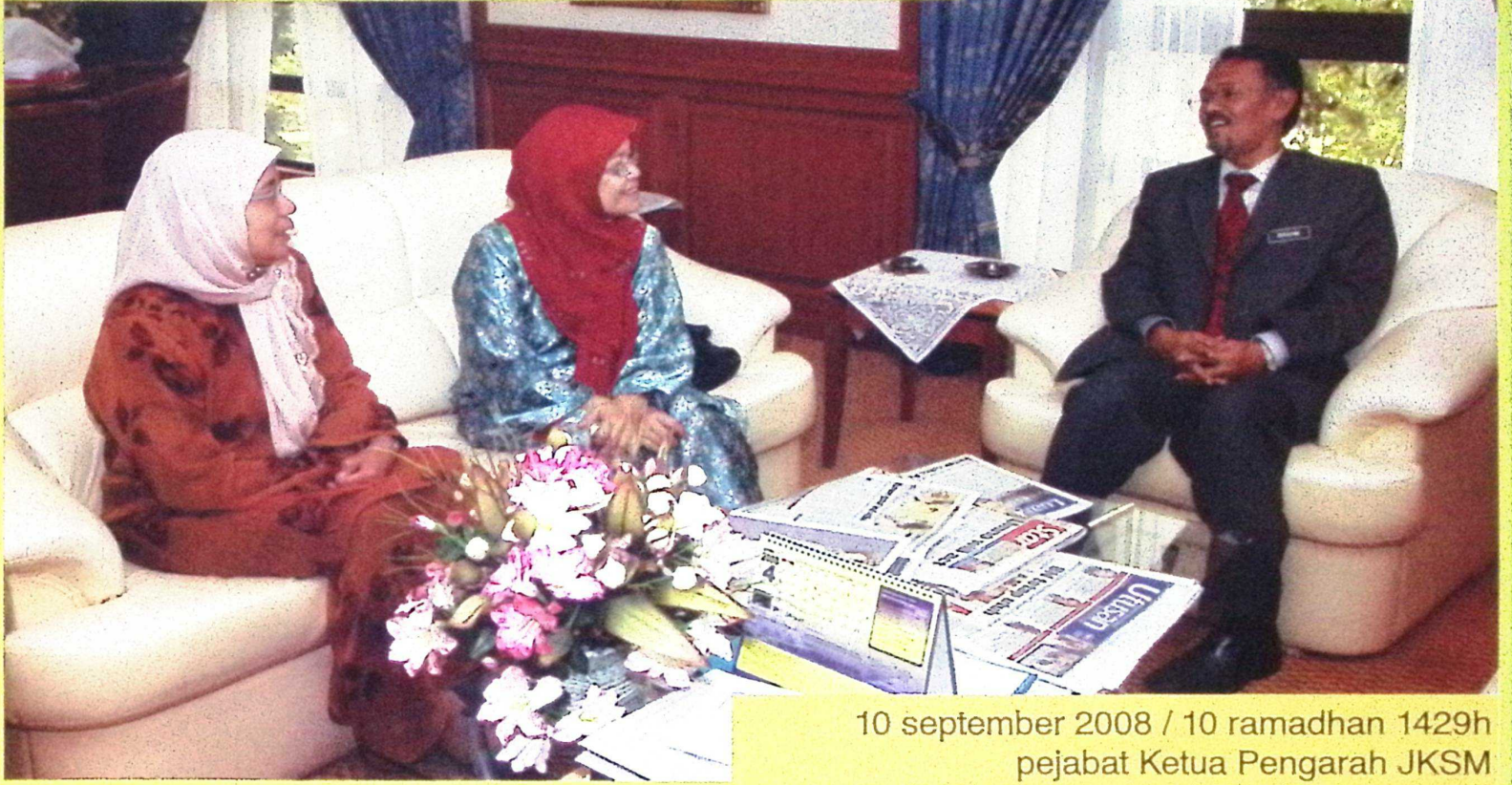
10 september 2008 / 10 ramadhan 1429h pejabat Ketua Pengarah JKSM