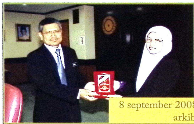
8 september 2008 / 8 ramadhan 1429h