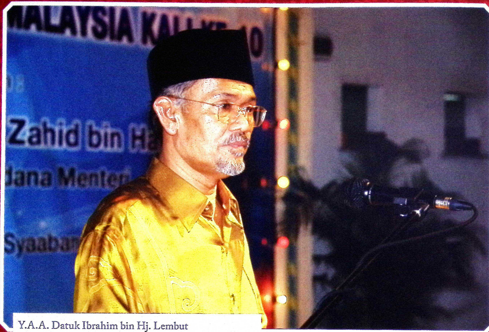
Y.A.A. Datuk Ibrahim bin Hj. Lembut Ketua Pengarah/ Ketua Hakim Syarie JKSM,

Hari Kedua // 27 Ogos 2008 / 25 Syaaban 1429H (Rabu)