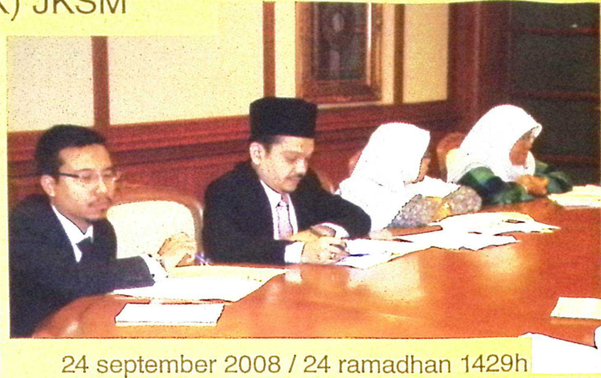
24 september 2008 / 24 ramadhan 1429h bilik mesyuarat Ketua Pengarah JKSM