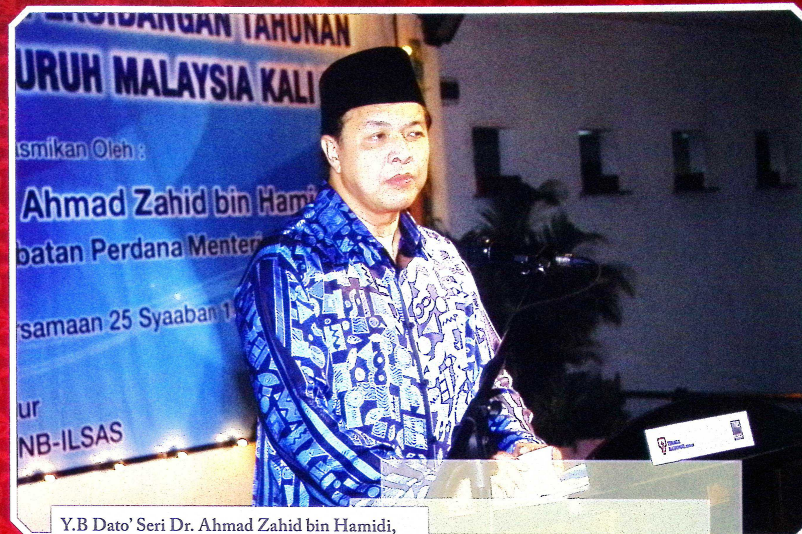
Y.B Dato' Seri Dr. Ahmad Zahid bin Hamidi, Menteri di Jabatan Perdana Menteri