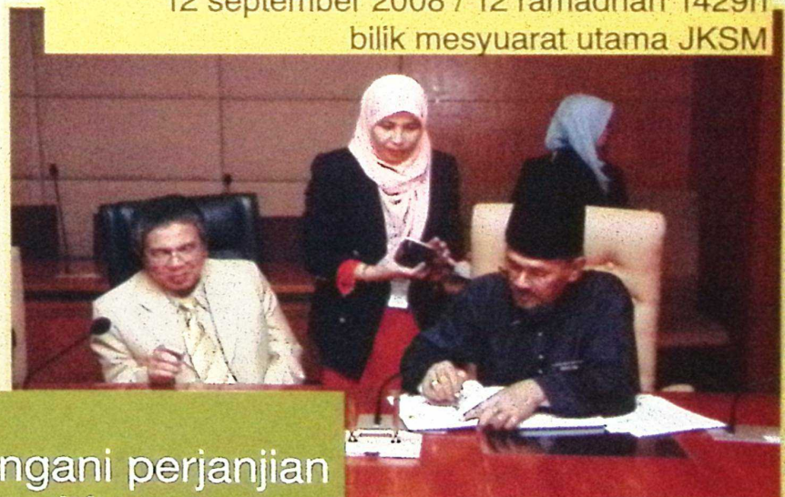
majlis menandatangani perjanjian Electronic Training Management System dengan Multimedia Synergy Corporation